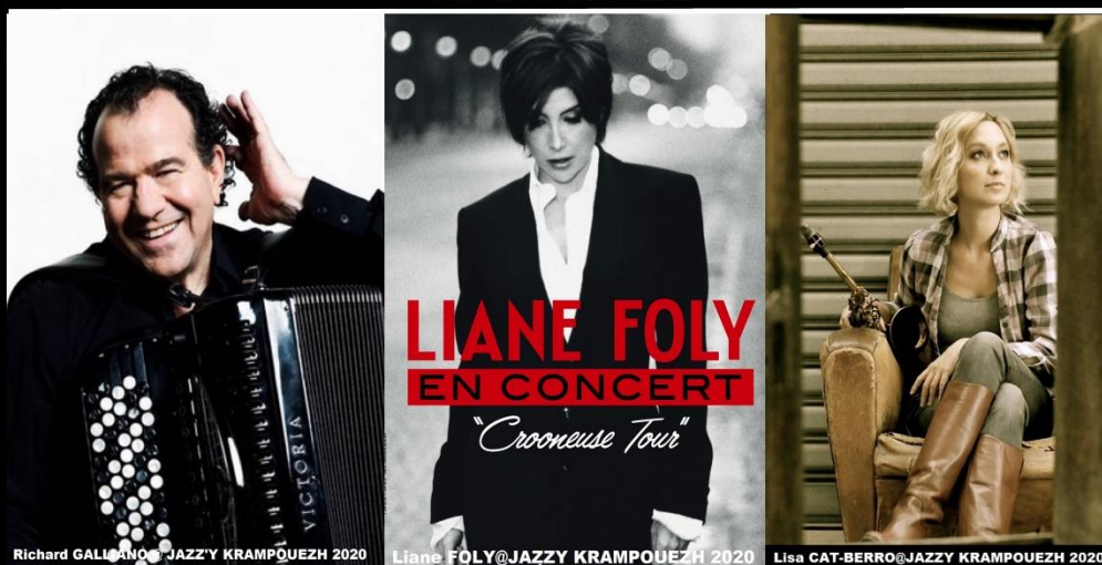
Richard GALLIANO @ JAZZ'Y KRAMPOUEZH 2020