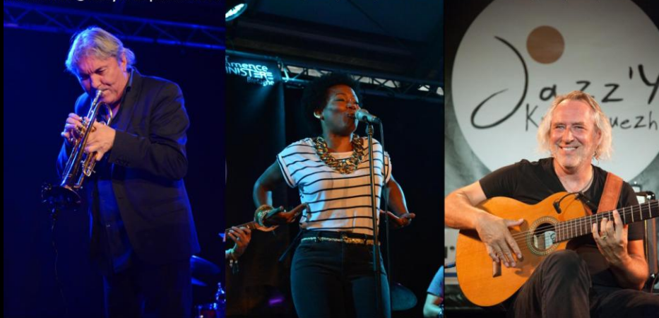
Photos de l'album Jazz'y Krampouezh 2016