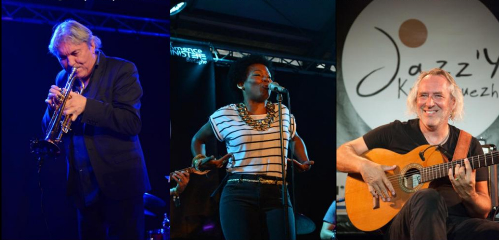
Photos de l'album Jazz'y Krampouezh 2016