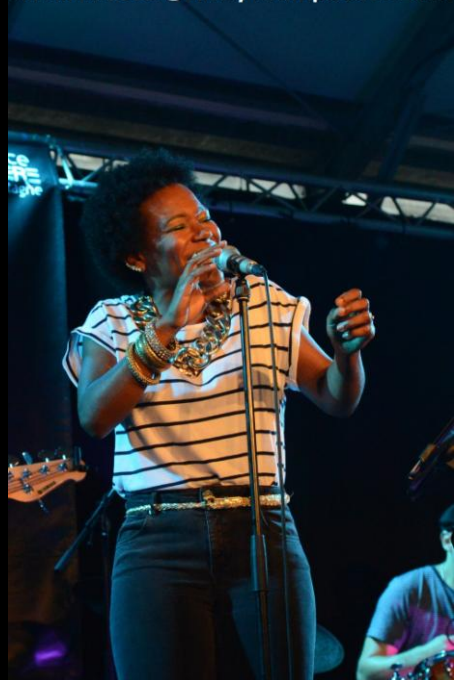
China MOSES @Jazz'y Krampouezh 2016